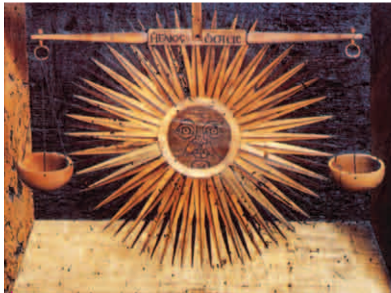
Postergale di un sedile a destra con il Sole, particolare

fu allungata l'abside e tutto il coro spostato nella parte posteriore dell'edificio, dietro l'Altar Maggiore. Quando qui si tengono i concerti, che partono dall'abside e che certamente sono apprezzabili, con un piccolo sforzo si può immaginare quanto più apprezzabili sarebbero quelle stesse note se si levassero libere nello spazio centrale sotto la cupola. Il trasferimento nella parte absidale comportò anche un parziale nuovo assetto della struttura del coro: si rese necessaria l'aggiunta di tre nuovi stalli a chiusura dei due corpi. Sono quelli della parte centrale contro la parete dell'abside e non hanno alcun intarsio. Al di sopra fa mostra di sé la Madonna Sistina di Raffaello nella copia di Piero Antonio Avanzini. Ma, nel