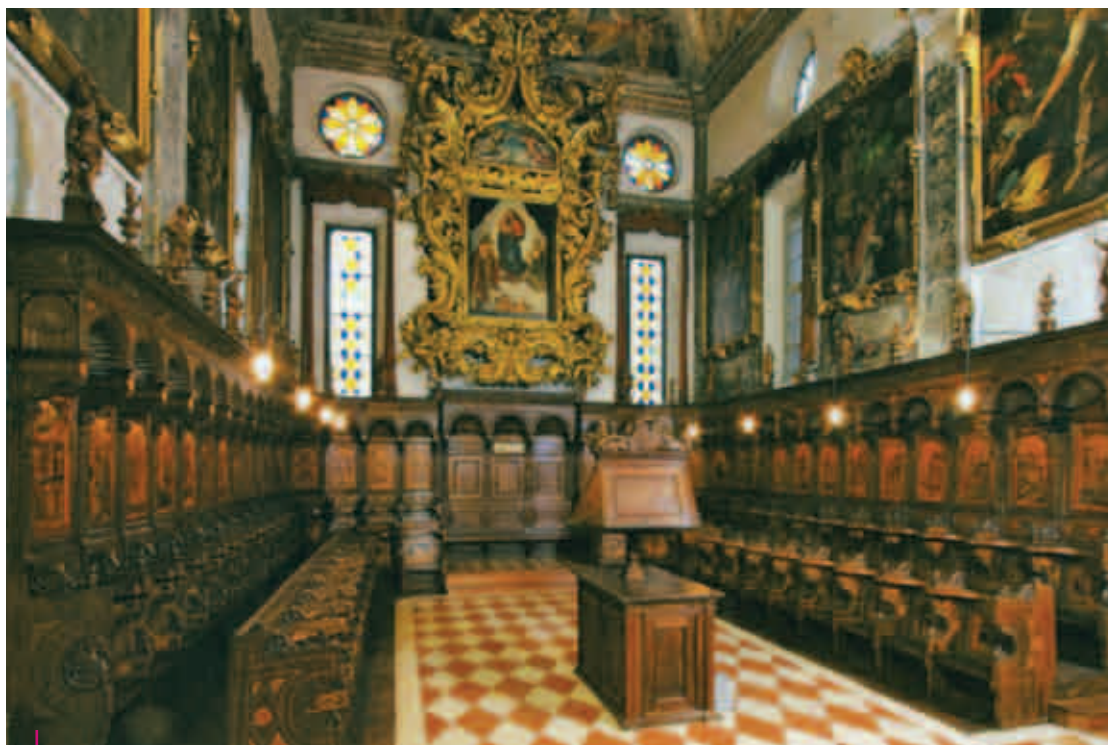
Veduta d'insieme del coro nella parte absidale di San Sisto