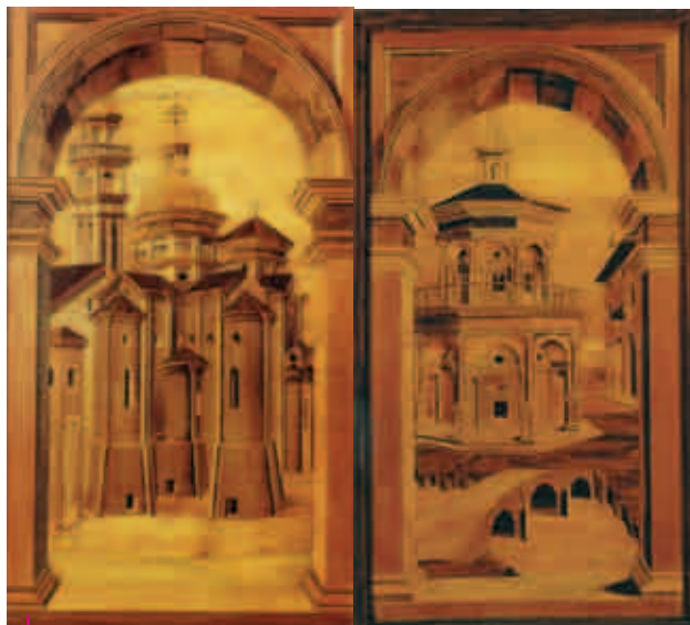
San Sisto, pannelli intarsiati. A sinistra: raffigurazione delle absidi della chiesa; a destra: pannello con tempio

immagini si aggiungono poche altre raffigurazioni, una delle quali suggestiva ed in apparenza misteriosa. Su tutti i dossali degli scranni superiori, quelli di più immediato impatto visivo, si aprono le vedute di città ideali nelle quali il taglio prospettico affascina nella sua accentuazione e vedute di reali costruzioni ben identificabili. Il dibattito filosofico ed artistico radicato al Platonismo ed elaborato dagli umanisti - in essere tra la fine del Quattrocento e il primo Cinquecento - vedeva porsi il concetto di armonia, fondata sul numero, che si trovava alla base tanto della