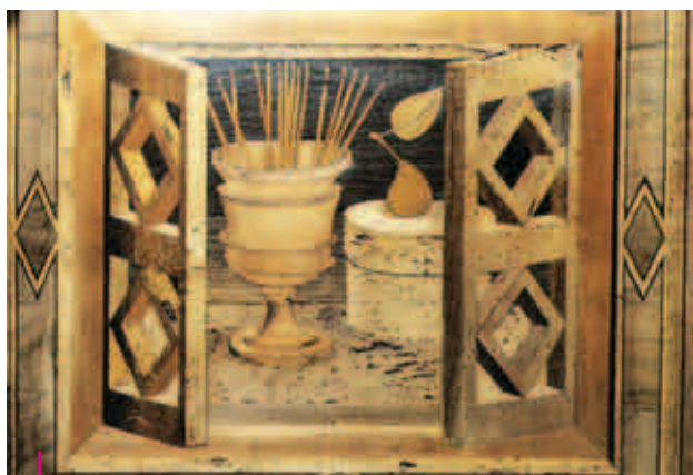
Coro di San Sisto, pannello intarsiato

architettura; la città è il luogo in cui l'uomo può realizzare un armonico ordine sociale, ma anche il luogo concreto dell'architettura che è disciplinata da precise proporzioni e organizza prospetticamente lo spazio: la serie di vedute di città ci si presenta sui dossali più alti e più grandi. La città come luogo di realizzazione dell'uomo. Accanto alle vedute ideali si notano precisi riferimenti a edifici reali: la stessa chiesa di San Sisto, raffigurata dalla parte del coro nella posizione originaria, Santa Maria di Campagna, Castel Sant'Angelo. Unica eccezione tra tutte le raffigurazioni architettoniche è la presenza